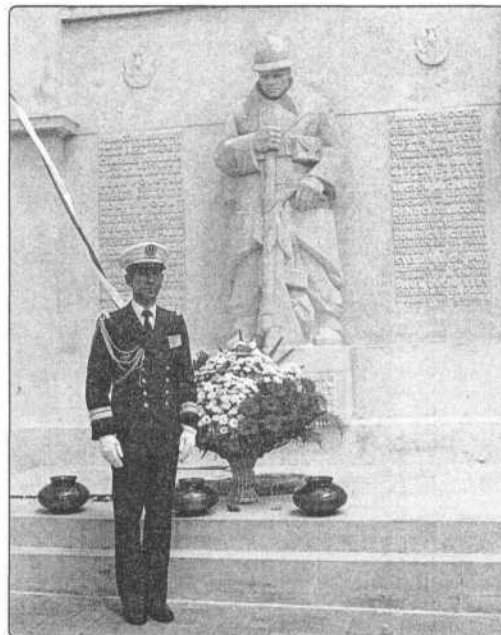
24 czerwca 2005 r. Odrestaurowany pomnik Piechurów Francuskich.

(Z Przewodnika po Cmentarzu Obrońców Lwowa, Wydawca Straż Mogił Polskich Bohaterów z 1939 r.)