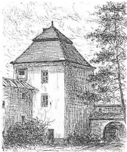
Wieża zamku w Zółkwi