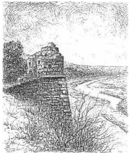
Okop św. Trójcy