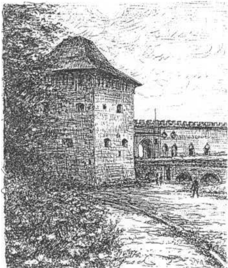
Twierdza w Międzyborzu