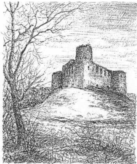
Ruiny zamku w Sidorowie

Dziesiątki zamków strzegły kresów Rzeczypospolitej. Już wiek XIV odnotowuje ich obecność w Buczaczu, Czerwonogrodzie, Łopatynie, Olesku i Trembowli. W sto lat później przybywa ich w Jazłowcu Pomorzanie i Zbarażu. Budownictwo XVI wieku powiększa jeszcze liczbę zamków o Brzeżany, Czortków, Tarnopol, Zborów i Husiatyn. W dalszych lat sto liczba zamków idzie już w dziesiątki