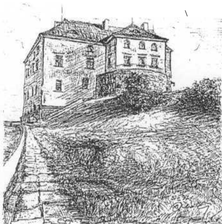
Zamek w Olesku